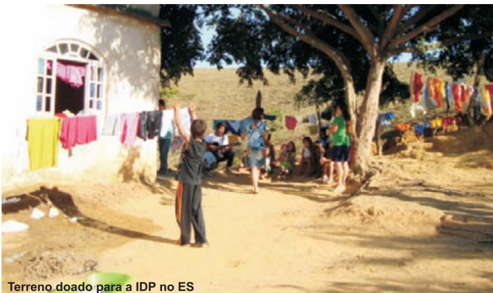
Terreno doado para a IDP no ES

Não se esqueçam de participar do projeto adotando evangelistas , hoje temos onze pessoas participando mensalmente e a arrecadação é de