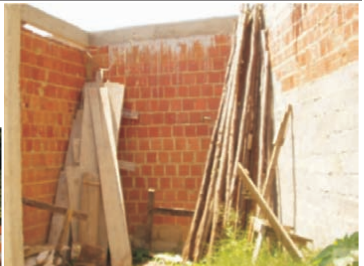
Visão interna da construção