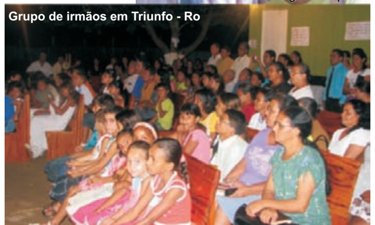
Grupo de irmãos em Triunfo - Ro