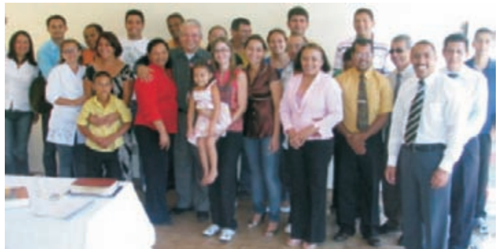
Grupo de irmãos presentes durante a oficialização da missão

Mais uma bandeira estadual tem sido hasteada na sede nacional. A Igreja de Deus da Profecia alcançou o estado do Pará abrindo ali uma nova missão.