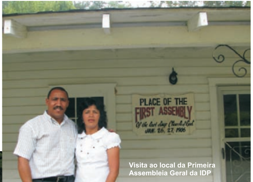
Visita ao local da Primeira Assembleia Geral da IDP