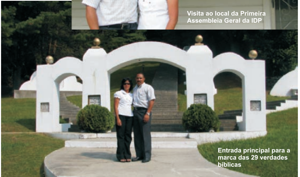
Entrada principal para a marca das 29 verdades bíblicas