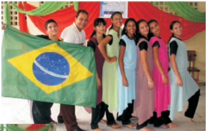
Participantes do acampamento