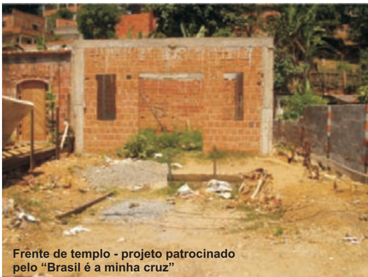
Frente de templo - projeto patrocinado pelo "Brasil é a minha cruz"