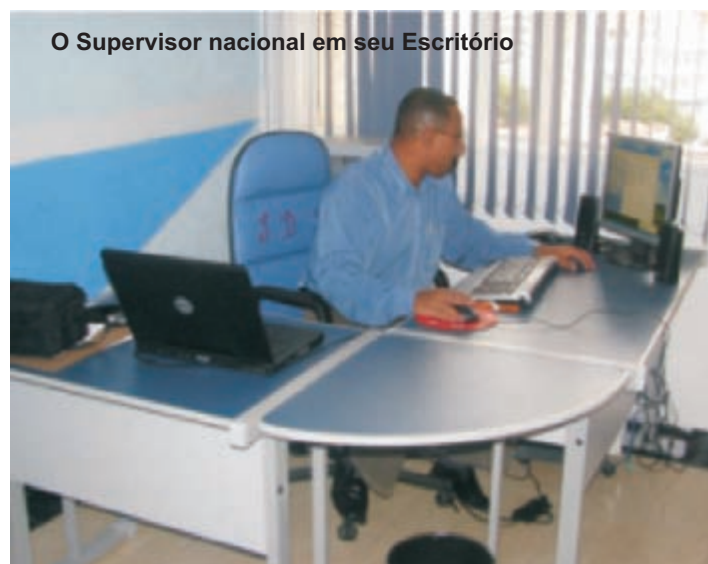
O Supervisor nacional em seu Escritório

Damos glórias a Deus por mais esta vitória!!